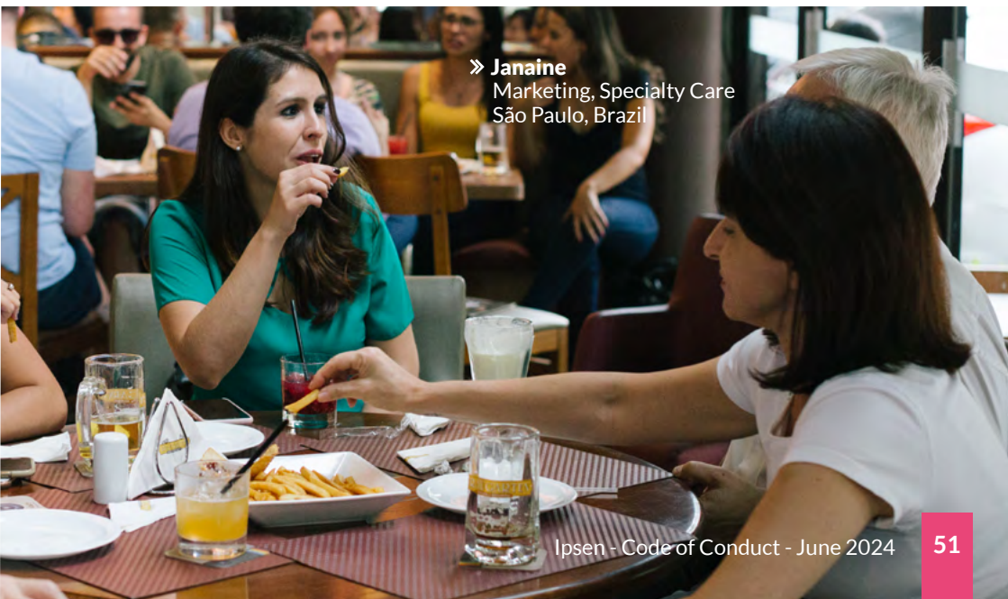
» Janaine Marketing, Specialty Care São Paulo, Brazil

Je refuse la proposition et j'en informe immédiatement les départements Business Ethics et Juridique. Ipsen ne doit fournir quoi que ce soit de valeur, comme des prises en charge pour participer aux congrès, en vue de conserver un avantage commercial. Ces prises en charge ne sont fournies qu'à des fins éducatives.