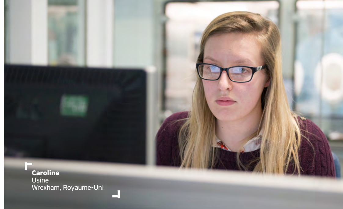
Caroline Usine Wrexham, Royaume-Uni