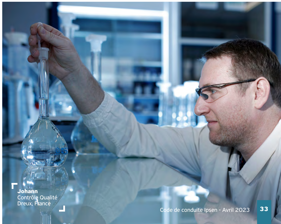
Johann Contrôle Qualité Dreux, France

Non. Je peux uniquement fournir aux professionnels de santé les matériels et contenus qu'Ipsen a dûment approuvés pour cette utilisation prévue, conformément aux procédures sur les supports promotionnels applicables et dans le respect de la réglementation du pays relative à la date à laquelle la promotion des nouveaux produits ou des nouvelles indications peut commencer.