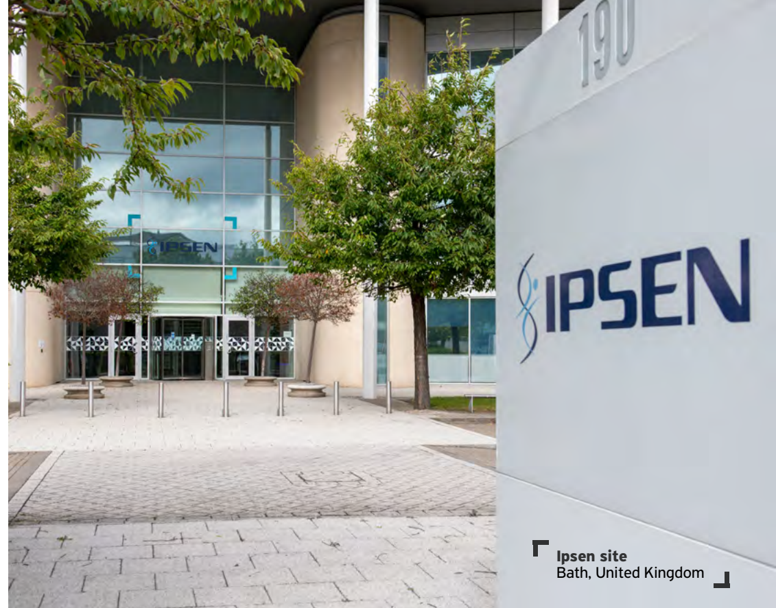
Ipsen site Bath, United Kingdom

Nous pouvons contacter le département Affaires Publiques et consulter la directive « Interactions with Policy Makers » (GLB-DIR-006). Si quelque chose nous préoccupe, nous en parlons avec notre manager ou avec l'équipe Business Ethics. Nous pouvons aussi utiliser la plateforme de signalement Whispli ( https://app.whispli.com/IpsenAlerts ) ou envoyer un courriel à Ipsen.Ethics.Hotline@ipsen.com .