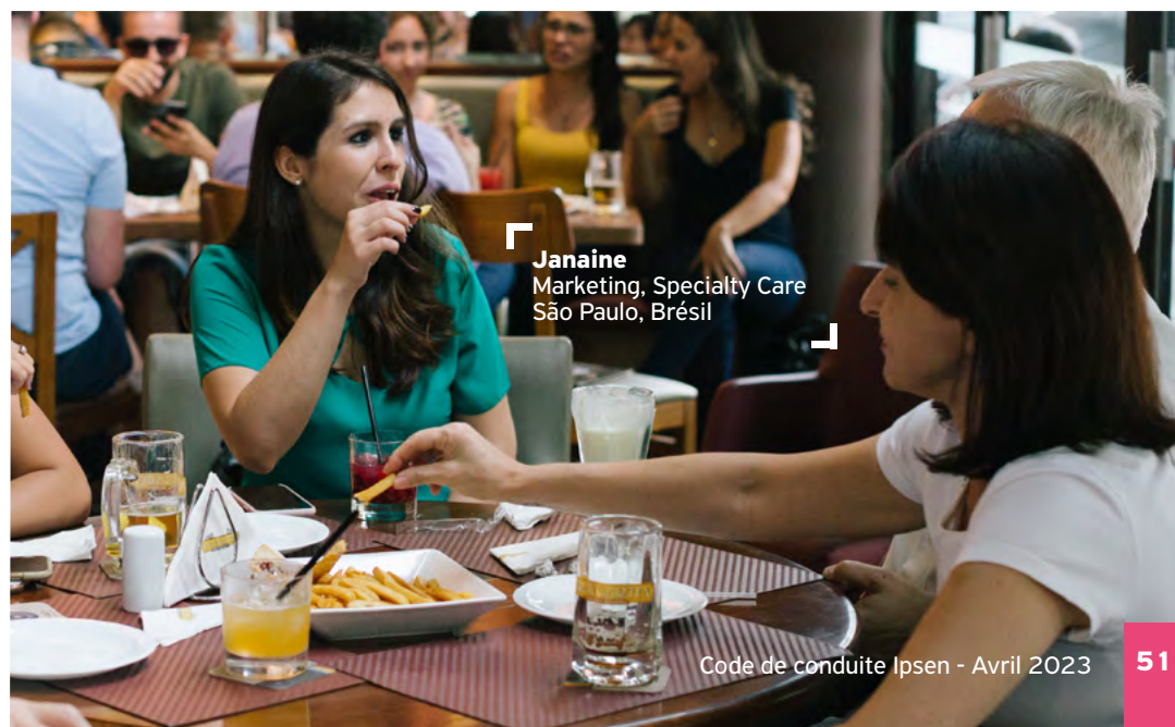
Janaine Marketing, Specialty Care São Paulo, Brésil

Je refuse la proposition et j'en informe immédiatement les départements Business Ethics et Juridique. Ipsen ne doit fournir quoi que ce soit de valeur, comme des prises en charge pour participer aux congrès, en vue de conserver un avantage commercial. Ces prises en charge ne sont fournies qu'à des fins éducatives.