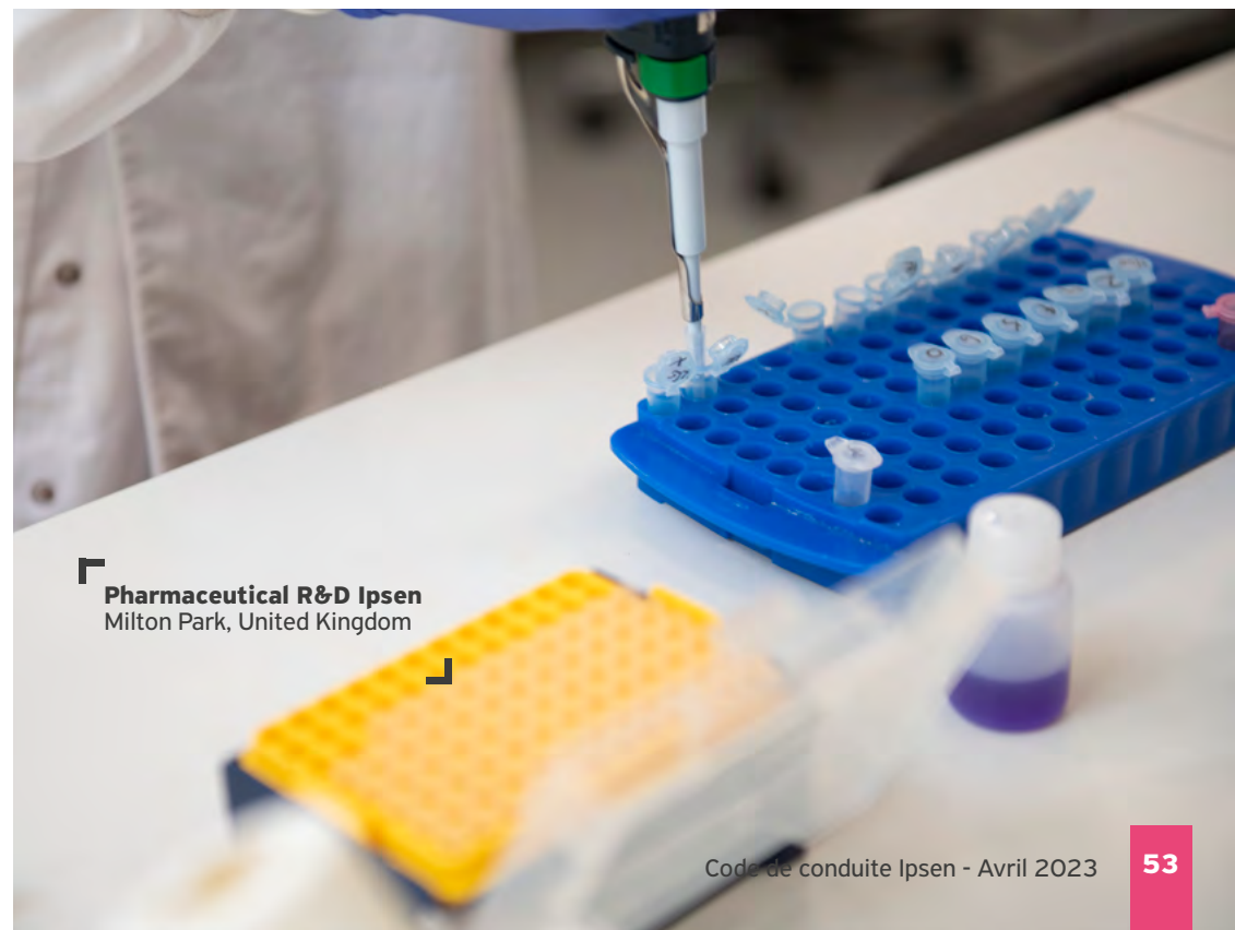
Pharmaceutical R&D Ipsen Milton Park, United Kingdom

J'informe immédiatement l'équipe Business Ethics pour évaluer la situation et faire le nécessaire. Ipsen peut être tenu responsable des agissements des tiers avec qui elle interagit. Il est par conséquent très important que nous n'interagissions qu'avec des partenaires fiables et de bonne réputation.