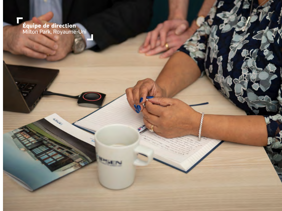
Équipe de direction Milton Park, Royaume-Uni

Si nous avons des questions ou si quelque chose nous préoccupe, nous nous adressons à notre manager ou au département Global Communications.