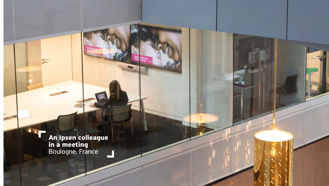
An Ipsen colleague in a meeting Boulogne, France

nous investissons dans un concurrent, un fournisseur ou un client, un membre de notre famille désire faire des affaires avec Ipsen ou nous acceptons de siéger au conseil d'une autre société.