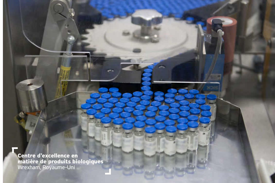
Centre d'excellence en matière de produits biologiques Wrexham, Royaume-Uni

Nous pouvons contacter le département Market Access department. Si quelque chose nous préoccupe, nous en parlons avec notre manager ou avec l'équipe Business Ethics. Nous pouvons aussi utiliser la plateforme de signalement Whispli ( https://app.whispli.com/IpsenAlerts ) ou envoyer un courriel à Ipsen.Ethics.Hotline@ipsen.com .